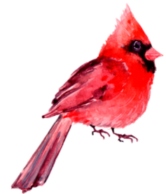
un pájaro a bird