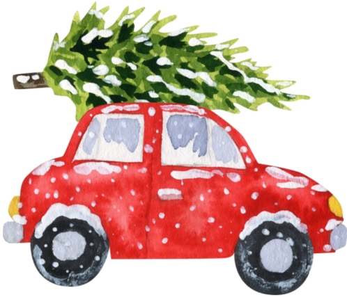
un carro rojo a red car

Busca por estos tesoros mientras viajas. Look for these treasures while travelling.