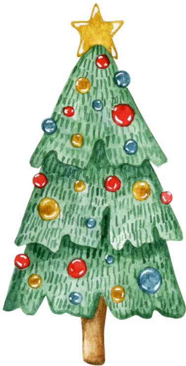
Un Árbol Navideño A Christmas Tree