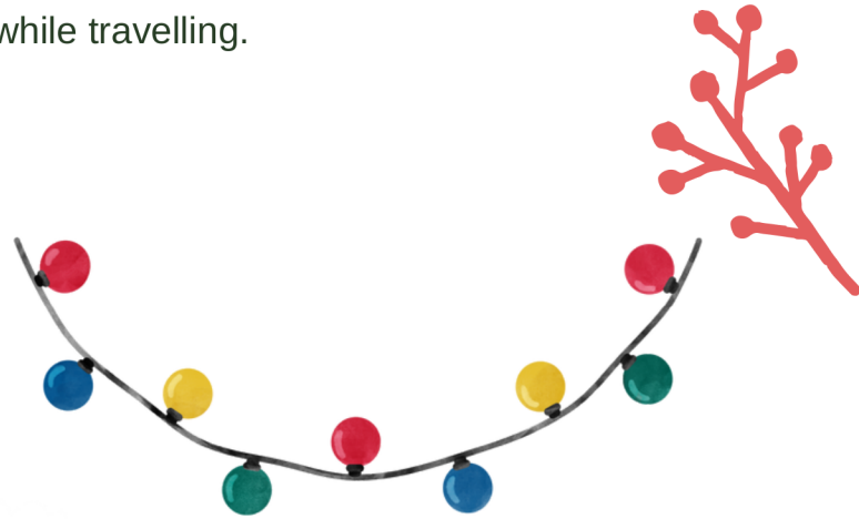
Luces Navideños Christmas Lights