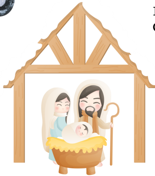
El Nacimiento The Nativity