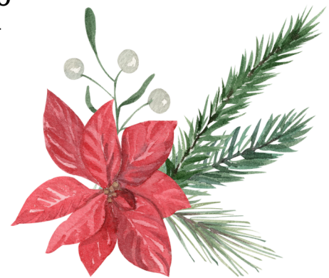
una flor de nochebuena a poinsettia flower